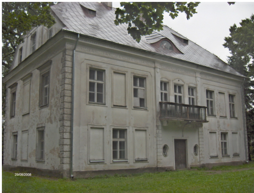
Fot. 1. Elewacja główna (wschodnia) i południowa pałacu

zlokalizowano sanitariaty. Na pierwszym poziomie poddasza, w holu, znajdowała się sala gimnastyczna.