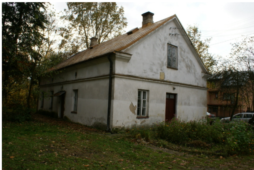
Fot. 1. Budynek administracyjny. Widok elewacji północnej i wschodniej