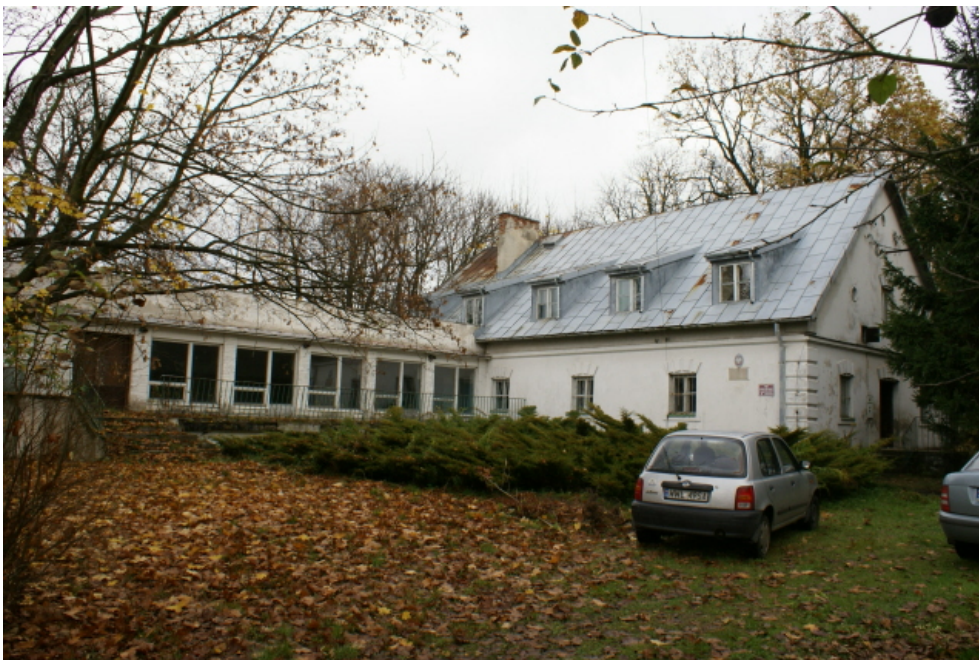
Fot. 1. Widok ogólny spichrza wraz z przybudówką z lat 60-tych ubiegłego wieku